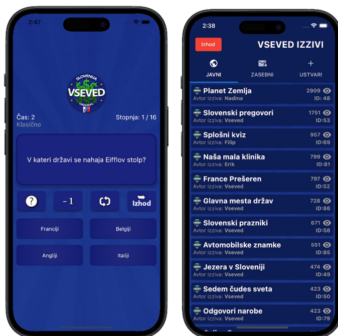
Slika 1: Grafičko korisničko sučelje VSEVED SLOVENIA