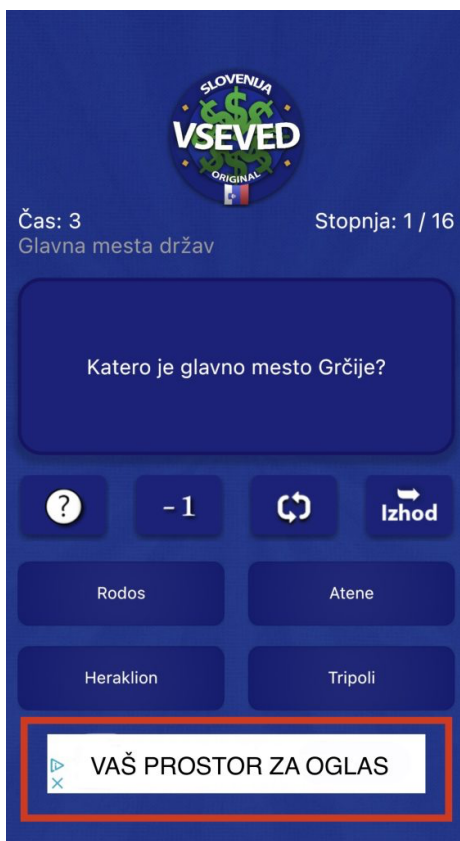
Slika 4: Prikaz oglasnog prostora u aplikaciji

U svim načinima igre (gore opisanim), aplikacija ima integrirani oglasni prostor na dnu zaslona. Veličina oglasa automatski se prilagođava uređaju.